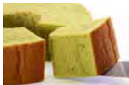
大和茶バームクーヘン