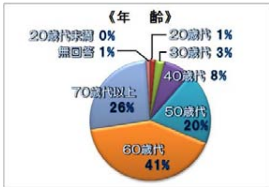
アンケート回答者の構成(年代別)