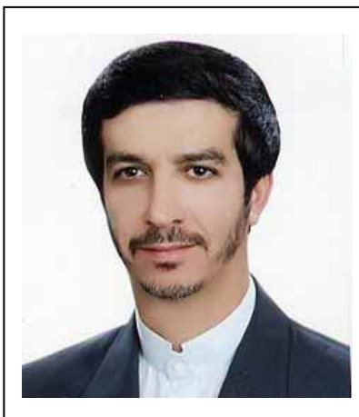
セイエドモルテザ サガイアンネジャード エスファハニ Sayedmorteza Saghaieiannejead Esfahani イスファハン市長

2002年よりイスファハン市長として二期目を務めている。米国にて理学士、理学修士、電気工学博士の学位を取得。また、イスファハン工科大学の学長を8年間(1982～1990)、イスファハン総合大学の学長を4年間務める。