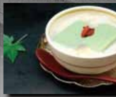
写真は商品イメージです。