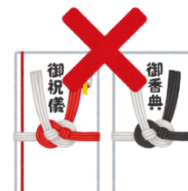
香典や祝儀は対象外

A17. 香典は補助対象外です。香典だけでなく、慶弔費として分類されるお祝いや見舞い等に関する金品は一切補助金の対象になりません。