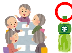
打合せ会議のお茶は補助対象

A13. 地域福祉活動や健康増進活動の行事を行うための打合せ会議のお菓子代は補助対象としていますが、総会や定例会、役員会の食糧費は対象ではありません。