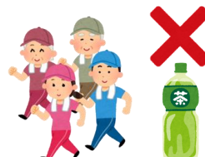
歩こう会のお茶は個人負担

A11. 体操やウォーキングの際のお茶は、個人で負担すべきものですので、補助金の対象にはなりません。お茶代として補助金からの支出が認められるのは、奉仕作業の時と、講師賄い、地域福祉活動や健康増進活動に関する打ち合わせ会議の時のみです。