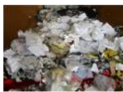
産業廃棄物 (廃プラスチック類)