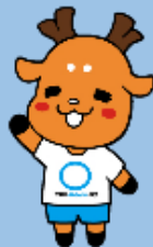
しかまるくん

食事や運動などの生活習慣の改善に関するアドバイスを専門職(保健師、管理栄養士等)が行います。この機会に、ご自身の生活習慣を専門職と一緒に見直してみませんか?