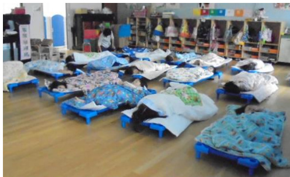
コットベットを使用してお昼寝の様

新型コロナウイルス感染症拡大防止対策として密を避けることを目的に導入。コットベット(午睡用ベット)を使用することで、敷布団の持ち帰りが不要となる。