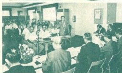
▲東市・明治・精華・帯解地区をトップに市政懇談会始まる=8月