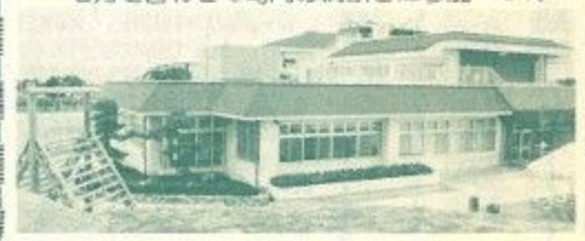
▲開館した横井児童館=8月