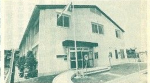
▲七条コミュニティー・スポーツ会館オープン=5月