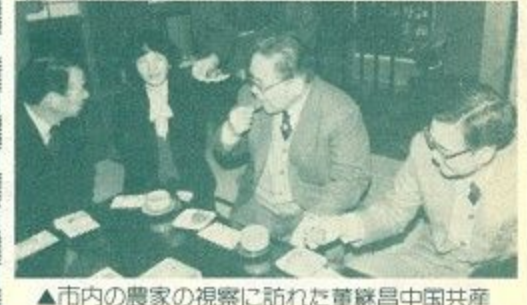
▲市内の農家の視察に訪れた董継昌中国共産党西安市委員会書記(中央)=1月