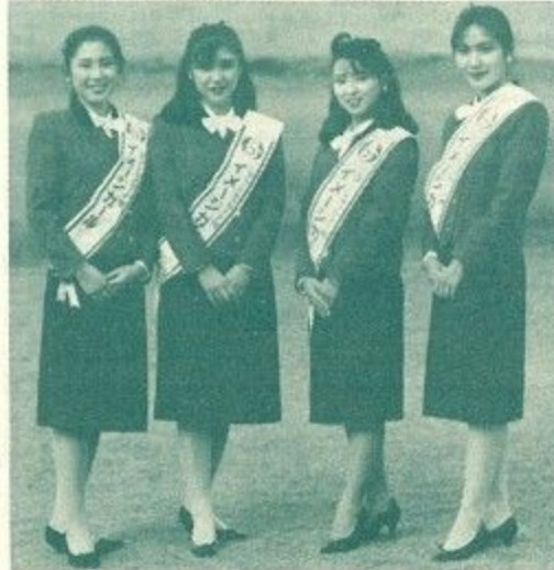
▲「なら・シルクロード博」のイメージガール4人選ばれる=9月