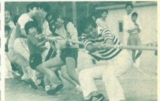
▲「ふれあい運動」実践活動に大人も子どもも力を合わせて町内の綱引きに参加=5月