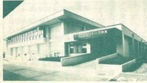
▲サン・アビリティーズ奈良開館=10月