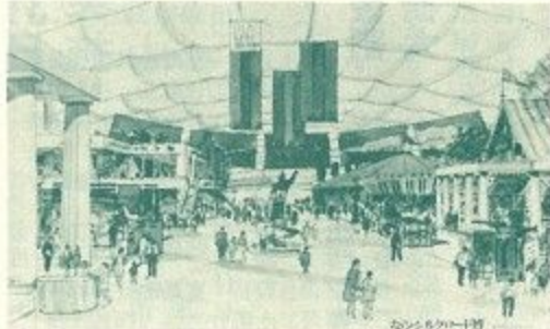
▲63年開会の「なら・シルクロード博」春日野グラウンド会場のイメージ図=6月