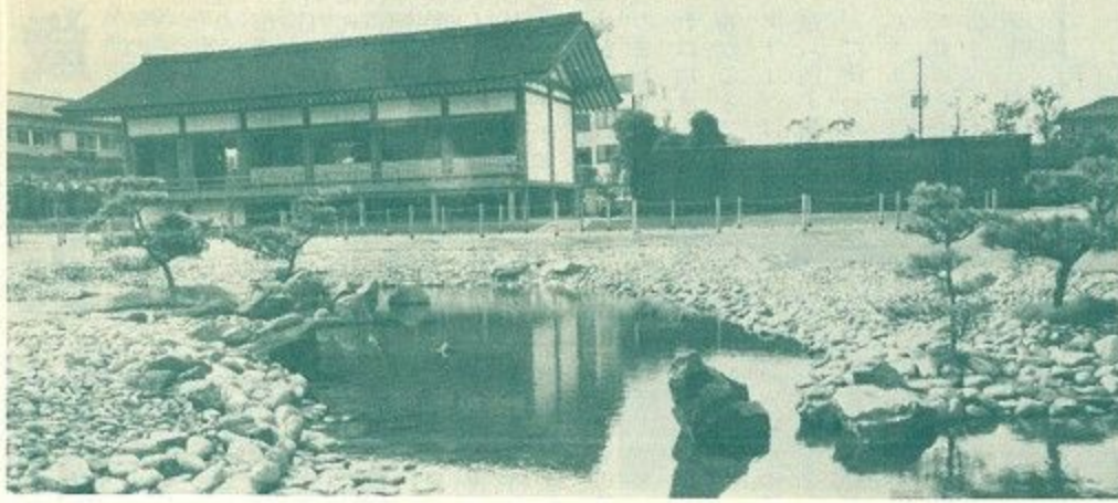
▲全国でも珍しく「特別史跡」・「特別名勝」のダブル指定を受けた宮跡庭園=10月