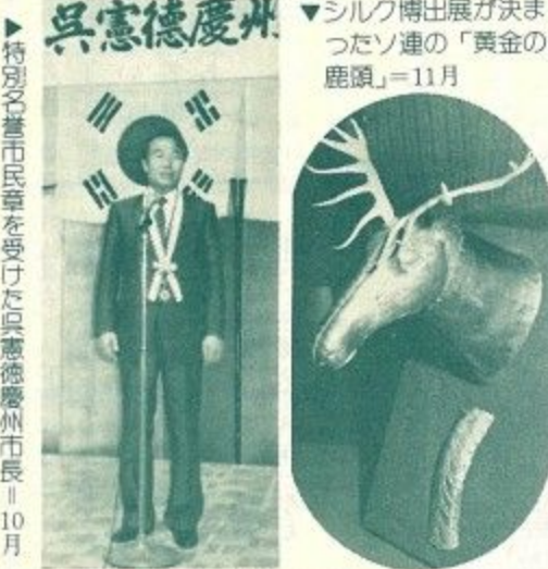
▲特別名誉市民章を受けた呉憲徳慶州市長=10月