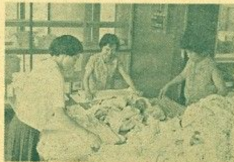
洗たくのお手伝いをする都跡婦人会