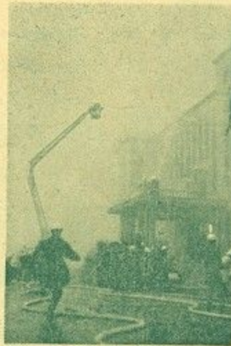
きびきびとした消火活動訓練

練で三市一町は10分距離にあることを証明できました。また三市一町で守りあう消防としての相互協力体制の確立に大変効果があり、いまや三市一町は一つの街であると思います。今後もこのような訓練をやって行きたい」とあいさつと、三市一町の消防ががっちりスクラムを組んで北和都市連合から火事をなくすことを誓いあいました。