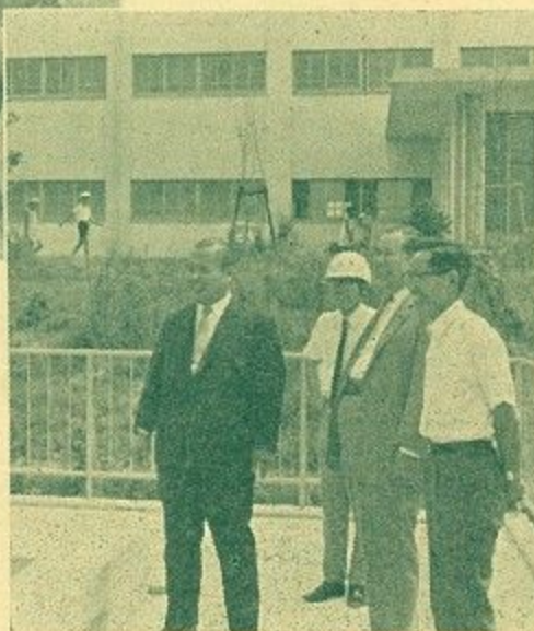
完成をともに喜ぶ市長と地元、市関係者

8月3日。プールに水が入った。きれいな水がいっぱいになった。子どもたちはお母さんの耳に、そっとささやいた。「ことしは、水の心配はないよ」