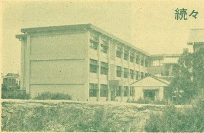
6月竣工の都跡小学校