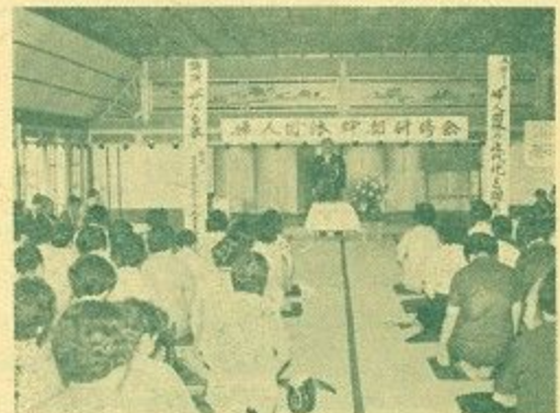
あいさつする市長

③活組織の強化は、まだ婦人会の組 織がされていない地域の人びとに進 んで入ってもらう体制をつくる。