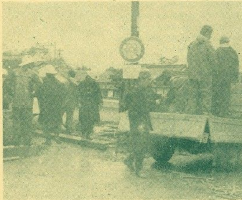
(大納言川復旧工事に地元消防団員ら大活躍)

去る7月2日、3日と、5日夕刻から6日にかけて2回にわたり北和地方一帯を襲った集中豪雨は、市内各地の河川、道路、田畑、学校、家屋などに大きな被害をもたらしました。