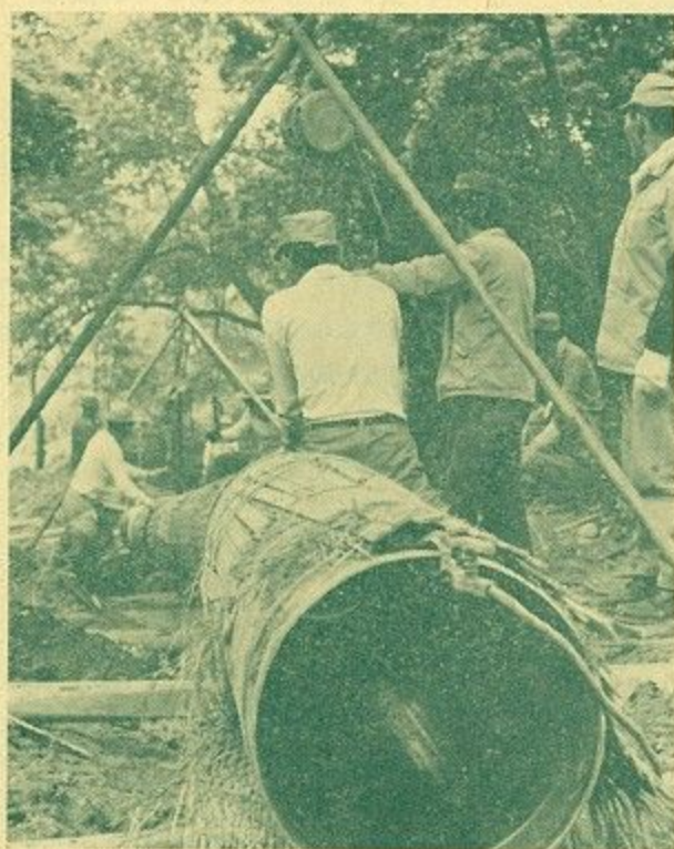
(豊かな水をとどける配水管布設工事)

奈良市の水道料金改訂案が、6月29日開かれた市議会本会議で原案通り可決され、7月1日から新料金に変わることになりました。