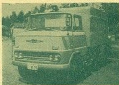
最新式大型ゴミ収集車

中型車は旧市全域で使用されますがこれで市のゴミ収集車は全部で23台になりその収集能力も大きくアップされました。