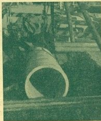
下水道5カ年計画布設延長

市教育委員会は、食生活の改善と豊かな生活設計に役立てるため5月1日から毎週火、木、金曜日の午後1時から高円公民館で家庭料理講習会を開いておりますが、5月11日の講習会に鍵田市長が1日講師として出席し自慢の印度カレーの作り方を披露し、会場あふれるばかりに、参加した受講者に大変喜ばれ好評でした。