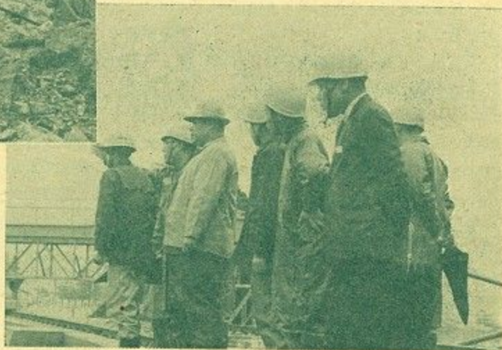
現場を視察する鎌田市長ほか(左より3人目)

このダムは、市民の皆さんに1日も早く水の不安を解消していただき豊かな水の街をつくるため、総額約5億円の建設費で市水道局が全力をあげて完成を急いでいる自然流下導水路事業計画の一部で、その最後の工事に当るものです。去る5月11日ダム地点の須川地区前川でコンクリート打設工事を開始、本格的な建設工事に着手しました。ダムは高さ31.50メートル、堤の長さ107メートルのドーム型アーチ式(宇治川天ガ瀬ダムと同じ型)で、12,000立方メ