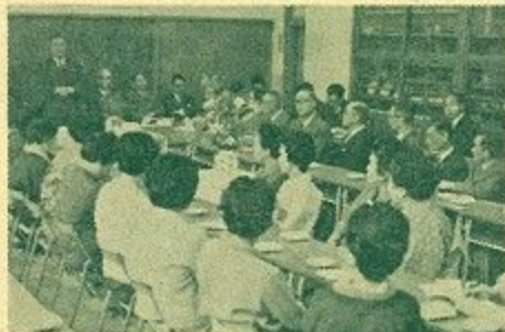
市政懇談会……椿井会場

ことし最初の市政懇談会が7日午後2時から椿井小学校校図工室で開かれました。この日地元からは自治会、民生委員、老人会、商店街、育友会、婦人などの各代表のほか多数の市民も参加し、前回はうまわる参加となりました。市からは市長、助役を