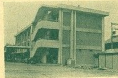
(大安寺小学校校舎)

市では、よい子のみなさんに、明るく安全な学校で、より充実した教育を受けていただくため、その施設整備に力を入れております。その一つとして大安寺小学校々舎の改築工事が終り、3月15日に落成式が行なわれました。