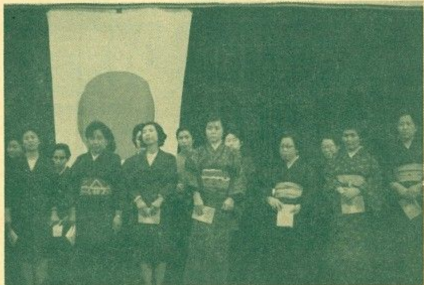
(高門音楽教室の学習発表)

このことについてのご希望やお問い合わせは、奈良市高畑町奈良市教育委員会社会教育課（電話②1313番）へ