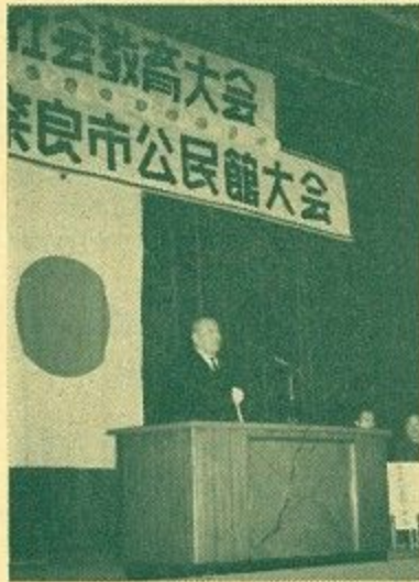
(あいさつをする市長)

奈良市公民館活動の実体を発表し社会教育の重要性を市民の皆さんに理解していただくことを目的とした標記の大会が、3月2日～3日の2日間にわたり、奈良市庁別館で開かれました。