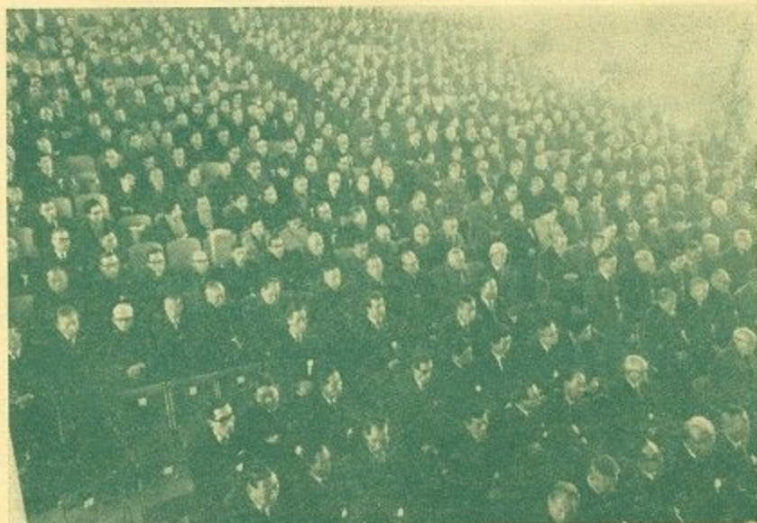
(会場いっぱいの来賓)

つづいて奥田知事をはじめ奈良市議会議長ほか各界代表の祝詞があり、奈良市民の歌を合唱、式典は簡素ながらも厳粛に行なわれ出席者は静かに奈良市成長のあとをかみしめ今後の発展を誓いあった。