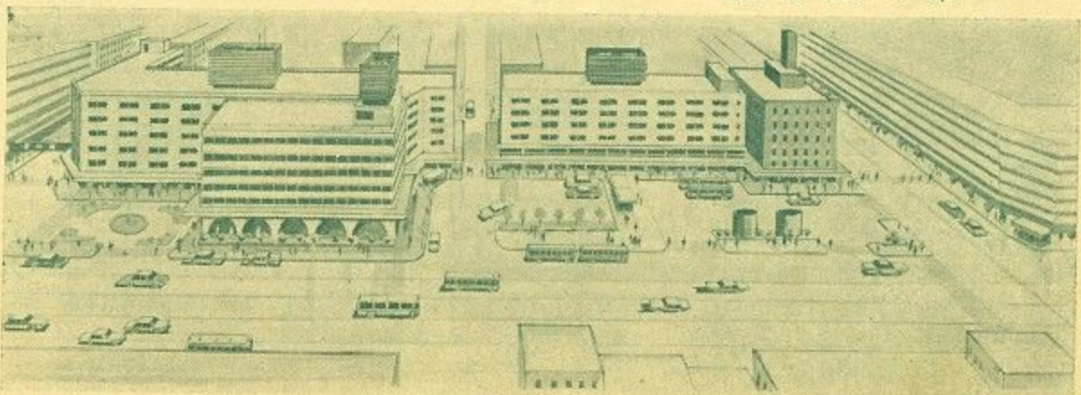
(近鉄奈良駅前完成予想図)