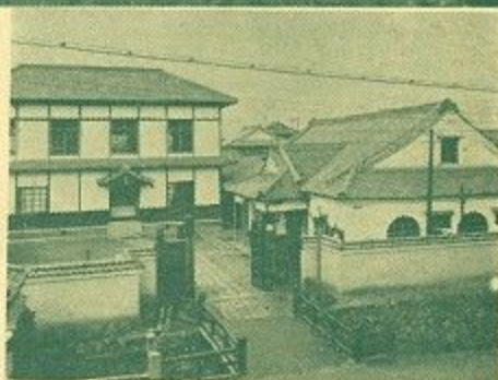
(昭和4年ごろの奈良市役所)

ここに、このような先人達の偉業をたたえ、“全日本人の心のふる里”として歩みをつづける大奈良市の、将来の発展を祈念し、市民のかたがたとともに、奈良市制発足70周年の記念行事を、有意義なものとして祝いたいと念願いたしております。