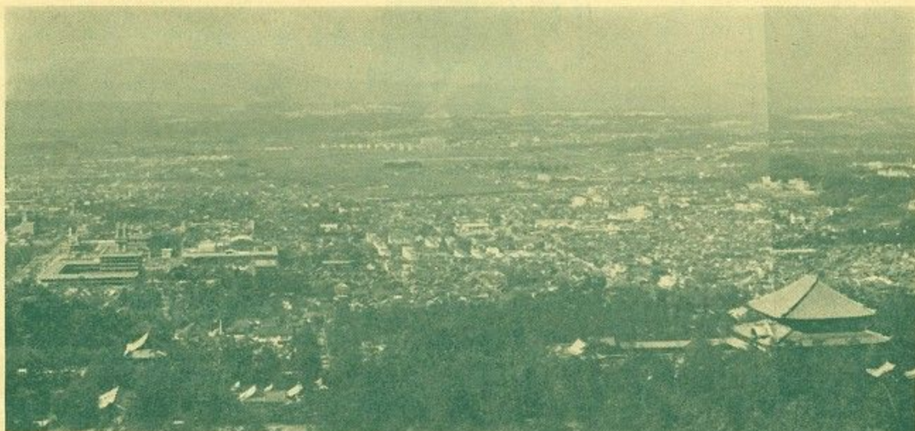
(若草山より市内を望む)

わたしたちのまち「大奈良市」は、古い伝統と歴史にはぐくまれながら、この2月1日で70歳の誕生日を迎えることになりました。明治31年、奈良市が市民のよろこびのうちに産ぶ声をあげたときは、3万人だった人口も佐保村を最初として、3町13村を合併と人口の急増により、今や18万人に、さらに都市連合などの計画をもって、名実ともに奈良県の政治・経済・産業・教育・文化の中心としての役割りを果たしつつあります。