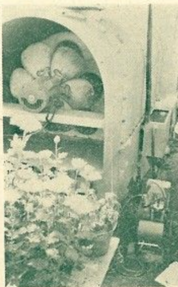
(右) 咲きみだれるポットマム