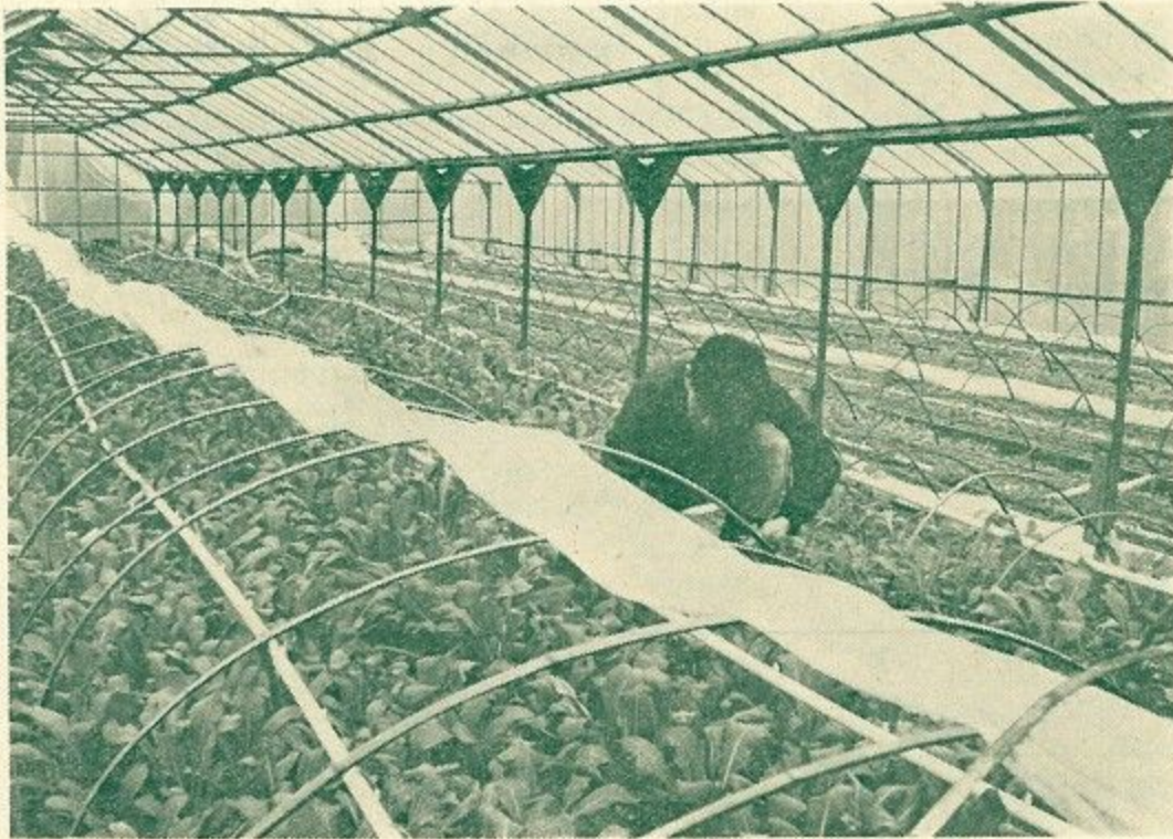
清浄そさい類の 砂栽培 (写真上)

砂地に野菜類を栽培することは奈良県内では初めての試みで、現在市内奈良阪町でその栽培が行なわれています。砂栽培によりまずと年間6毛作から、そさいの種類によっては12毛作も栽培できることが実用化されて、砂での清浄そさいの栽培は明るい見通しが話題となっています。