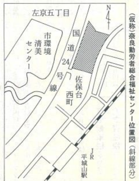
(仮称)奈良勤労者総合福祉センター位置図(斜線部分)

心豊かな人間性の形成と市民相互の連帯感や協力を高め、心のふれあう明るく住みよいまちづくりを進めるため、昭和六〇年から「市民ふれあい運動」を推進しています。そこで運動推進本部では地域、職域、団体、家庭などを一層広げるため、「第六回 今年参加しようとお考えの団体(自治会・子供会・サークル・仲良しグループなど)は、はがきか封書で団体名、代表者の住所・氏名・電話番号、当日の活動場所、活動内容(清掃の場合はゴミの集積場所見取図添付)、参加人数を書いて四月二十七日までに市広報公聴課内運動推進本部(〒630二条大路南一丁目、☎01-111)へ申し込んでください。