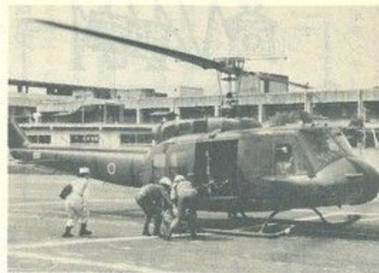
①被災地の偵察や負傷者の空輸に協力する自衛隊ヘリコプター ②炎上するビル(想定)からの救出訓練 ③地もと住民による初期消火訓練