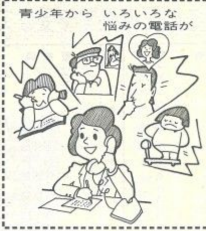
いろいろな電話が青少年から

八月、セミ時雨の中、電話で悩みの相談を受ける奈良「いのちの電話」協会事務局に伺い、現代の青少年たちは何に悩み、苦しんでいるかをお聞きしました。というのは、私自身三歳の娘を育てており、これからそういった問題にやがて直面する時が来るのに備えたいという気持ちと、多くの同じ立場にある方々に少しでも参考になればと考えたからです。