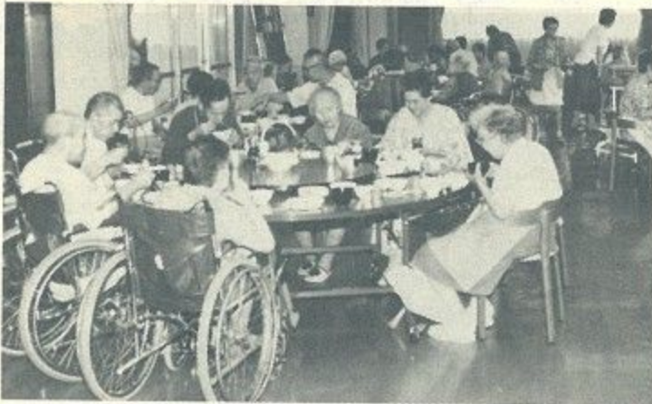
丸テーブルでなごやかに食事をとお年寄り

市の老人福祉課で奈良市の実情についての話を聞いたあと、痴呆性老人の専用収容施設を持つ県下唯一の特別養護老人ホーム「国見苑」(御所市)を訪れました。同ホームは、入所者百四十人の六割が痴呆性老人で占められています。