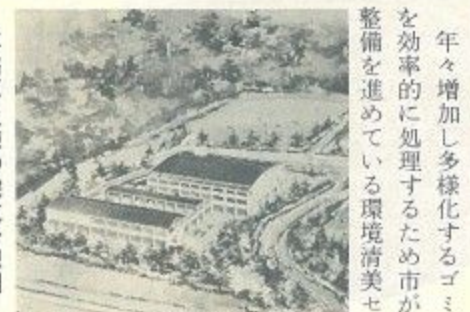
事務厚生棟の完成予想図

年々増加し多様化するゴミを効率的に処理するため市が整備を進めている環境清美センター(仮称)の事務厚生棟など、来年六月完成に向けて工事が始まりまし。このセンターは、現在ゴミ収集の基地(環境清美第一事務所)とゴミ処理を行う環境清美工場の間を国道24号線が通っているため東西に二分され、事務連絡が不便なうえに収集車の増車で駐車場がせまくなってきたことから、環境清美工場を中心とした処理部門と収集部門を統合し、清掃業務の拠点としようというものです。今回建設されるのは、環境清美工場南側の約一万一千四百平方メートルの敷地に鉄筋三階建ての事務厚生棟(延べ床面積四千二百二十四平方メートル)と鉄筋二階建ての駐車場(延べ床面積二千四百六十六平方メートル)の両棟で、事務厚生棟は事務室のほか会議室や更衣室が、駐車場はゴミ収集車など二百二十七台が収容できる施設となっています。これが完成すれば、環境清美第一事務所はすべてここに移転することになります。