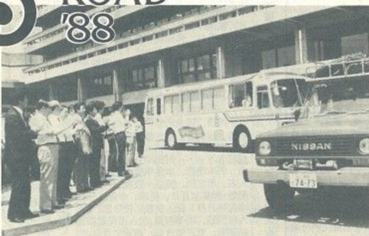
たくさんの人に見送られ、県庁前を出発するPRキャラバン隊