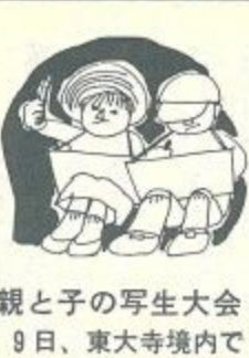
親子の写生大会 9日、東大寺境内で

夏休み親子のお菓子づくり 8月23日(日)午後2時〜4時半。興東中学校区の小学生とその親十二組。材料費五百円。筆記具、エプロン、ふきん、三角布、二百ccのびんを持参。