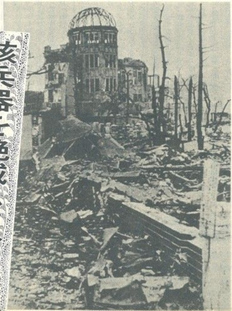
「原爆ドーム」(広島・一九四五年十月)

奈良市議会は、「非核三原則」(つくらず・持たず・持ち込ませず)の堅持や「あらゆる核兵器の全面禁止と廃絶」など、その実現に向かって努力することを内外に表明する「非核平和都市宣言」を一昨年の十二月、全会一致で決議しました。市でもその宣