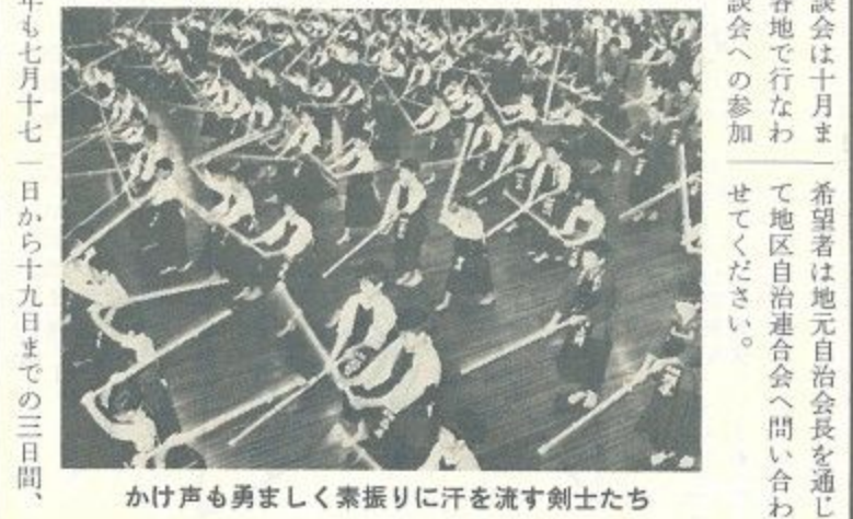
かけ声も勇ましく素振りに汗を流す剣士たち

なお、市政懇談会は十月までの日程で市内各地で行なわれます。この懇談会への参加を希望者は地元自治会長を通じて地区自治連合会へ問い合わせてください。