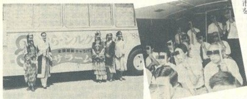
キャンペーンガールが案内する「サラーム号」(左)。まっ暗な車内では、立体映像でシルクロードの旅を体験