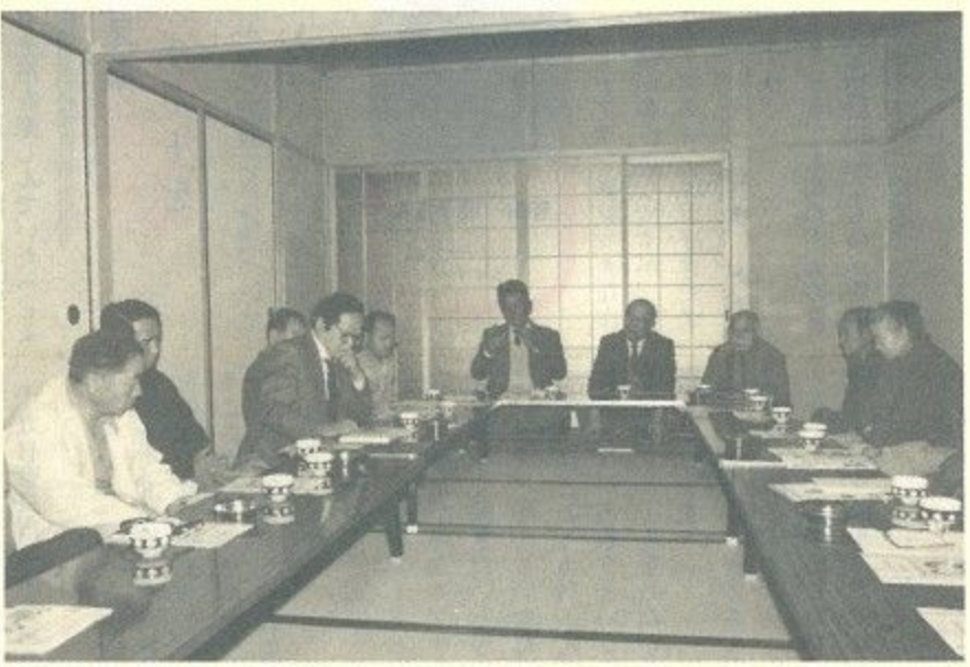
身近なところで同和問題を学習する地区別懇談会

僕は学校の道徳の授業で「人権」について習いました。そして、習い終わってから僕はこう考えた。「人権」とは人がそれぞれに生まれた時から持っている自由と平等の権利だと思ふ。 だから、人が人の自由や平