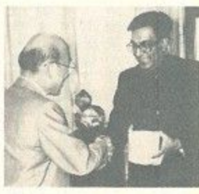
ダーラム・ピア・モハン在神戸インド総領事(写真右)が、新任あいさつのため市役所を訪れました。モハン総領事は、奈良の文化財や自然がよく保存されていることに感心。文化財や自然を保存しながら開発を進めている大切さを西田市長とみ