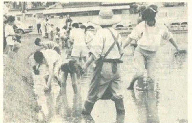
「ワー、きもちわるい」——泥んこの世界へ足を恐る恐る忍ばせるお母さんと子どもたち。六月十四日母子福祉センター「母と子の家」がおこなった田植えでの一コマ。(写真)最初はおっかなびっくりのお母さんや子どもたちも、いつの間にか苗の植え付けに一所懸命。丸めた腰を時々伸ばしながら、四十人が三十分で、約二アールの田にもち米の苗

を植え終わりました。いつも子どもたちの服の汚れを気づかうお母さんたちも、この日ばかりは、泥のはねを上げながら元気に走り回る子どもたちに「にっこり」。子どもたちの大きな歓声に日光浴を楽しんでいたへびも