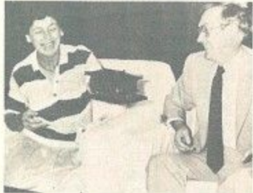
豪州のジェフリ・ミラー駐日大使とレイチェル同夫人(写真)が奈良市役所を表彰訪問しました。ミラー大使は、奈良の古い木造建築に関心があるよう、正倉院のミニチュアをめずらしげにながめながら、西田市長の説明を熱心に聞いていました。西田市長がこのミニチュアを同夫人にプレ