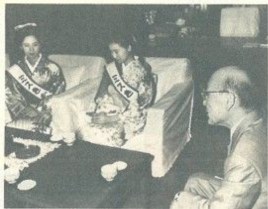
みれ、自然をいっぱい楽しんだ一日でした。