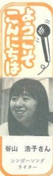
谷山 浩子さん シンガーソングライター

奈良の印象は……。山があつて、田んぼや畑があつて、とっても広々としていて、散歩するのに困らない所ですね。自分の音楽について、好きですね。作家では宮澤