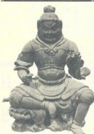
木造毘沙門天半跏像