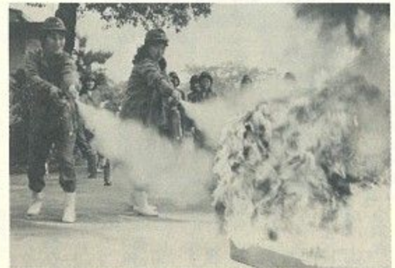
「初期消火は私たちにおまかせ」と早朝訓練