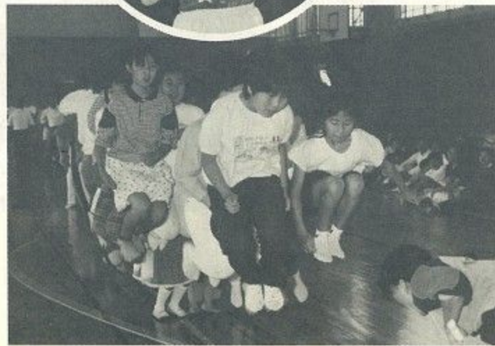
呼吸をあわせて イチ、ニイ、サ〜ン

この日参加したのは百九十五団体、二万三千六百人で、早朝のさわやかな空気を吸いながら心地よい汗を流しました。これはその幾つかのシーン。