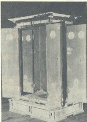
黒漆塗宮殿形厨子