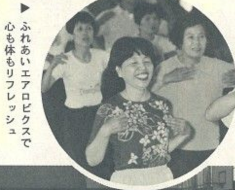
ふれあいエアロビクスで心も体もリフレッシュ

商工課—中小企業診断士が相談に応じます。相談希望の方は電話かきで商工課へ申し込んで下さい。相談日を通知します。