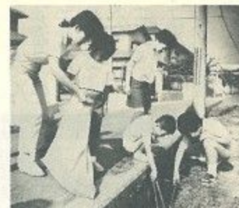
まちをきれいにしようとするみんな大活躍 右〓二月堂▽左上〓やすらぎの道▽左下〓 四条大路四丁目