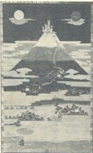
紙本着色富士参詣曼荼羅図