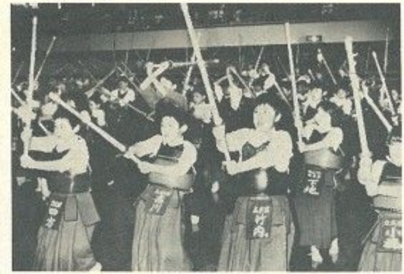
共に流す汗はふれあいの心を育む