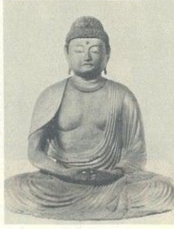
木造阿弥陀如来坐像