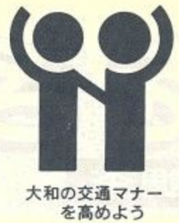
大和の交通マナーを高めよう

今年も「春の交通安全運動」が五月十一日～二十日までの十日間、全国いっせいに繰りひろげられます。