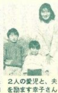
夫と2人の愛児を励ます幸子さん

大会出場は今年が初めて。「自分で目標を決めて走っていると、自分に対して厳しくしなければならぬから根性がつきましますよ。今日は五時を走るんです。頑張ります」と明るくさわやかな笑顔。