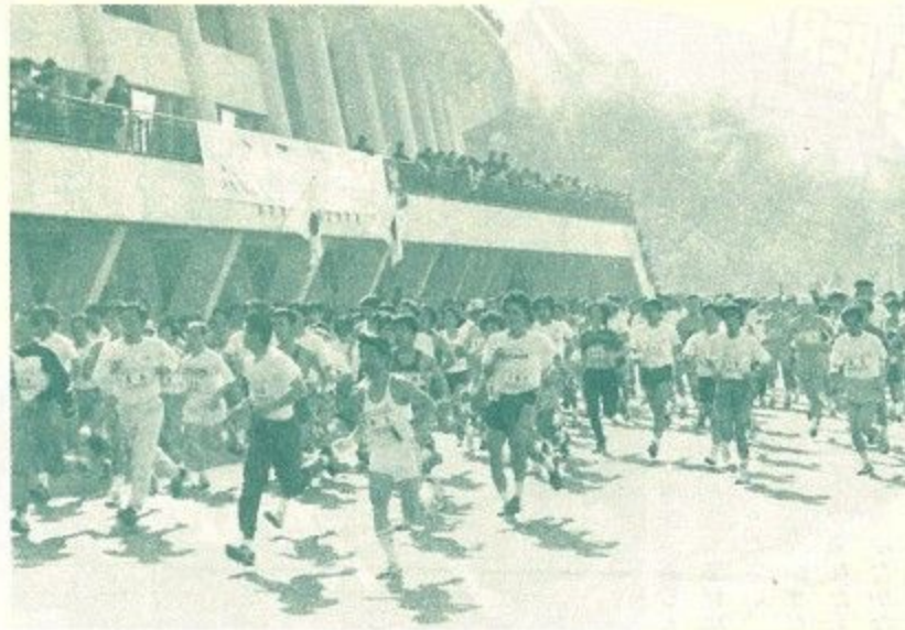
朝日を背に鴻ノ池陸上競技場をスタートする選手たち

第二十一回市民マラソン大会が二月十一日の「建国記念の日」に行われ、九百八人が参加、初夏を思わせるような日射しの中をひた走り、快い汗を流しました。 鴻ノ池陸上競技場から外環状線折り返しコースで、一部(十時)、二部(五時)、中学(十時)と出走直前の鴻ノ池陸上競技