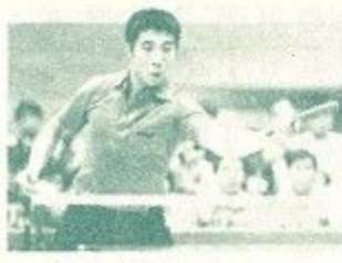
元全中国卓球選手 元全中国卓球選手