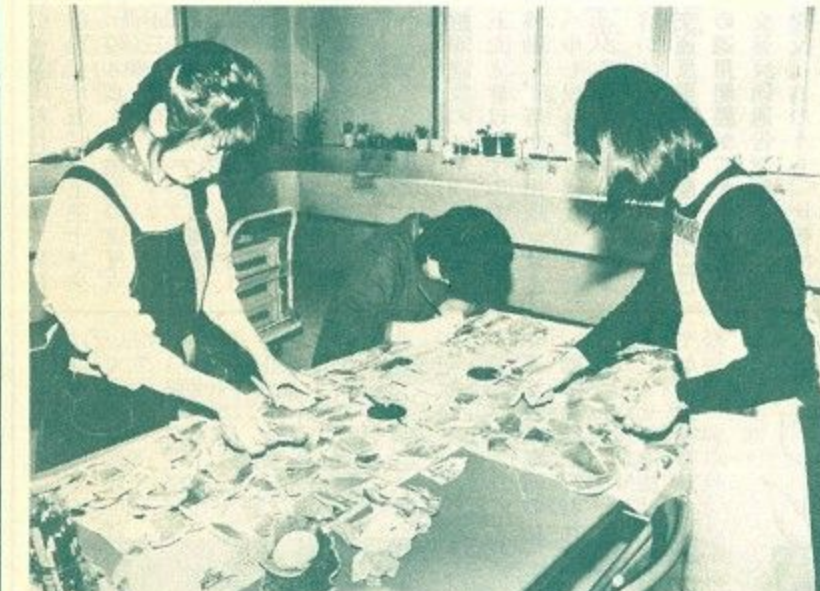
遺物ひとつひとつに出土場所・日付などを記すマーキング作業

奈良市にとって、埋蔵文化財の保存と開発がやはり大きな問題のようです。この問題は簡単に解決できるものではありませんが、子を持つ母親としては、貴重な文化財を少しでも暮らしに生かしていただきたいと思えます。