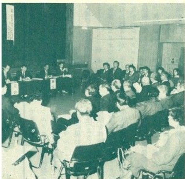
市民研修会に真剣に研修する市民