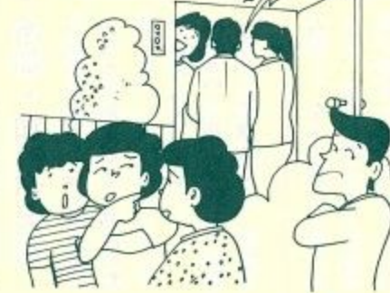
あの人の生まれはね……。

ところが、今でも日本の国民の一部の人びとが、根強い差別意識により基本的な人権を侵害されています。「胸をはって故郷（ふるさと）を名のれない」といことが実際にあるのです。このような、人間の基本的な人権をうばわれたいために起こっている色々の問題を「同和問題」と言っています。 「同和問題」とは、差別をなくし同和問題を解決するための教育で、けつして特別な教育ではありません。心もからだも共に健康な国民を育て、住みよい幸せな世の中をつくるために、みんなで考え協力して勉強するので