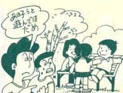
あの子は遊んでいい

や心情を培う。社会教育では、世の中に多く残っているまちがい（矛盾や偏見）、なかでも一番強く影響を受けている部落差別とそれを支えている一切の不合理をなくすための学習をすすめていきます。 私たちは、部落差別をわたしたち一人ひとりの問題としてとらえ、差別を許さぬ市民になりたいものです。