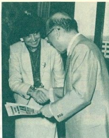
姉妹都市提携実現に向けて固く握手するプロスト助役(左)と西田市長