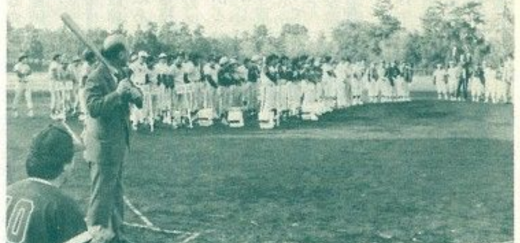
春日野・柏木・平城各球場で展開されます。

さまざまな職業の人たちが日・祝日のほか出勤前などに軟式野球を楽しむ職域早朝軟式野球大会(県・市など後援)の開会式が四月六日午前七時、さわやかな早朝の朝の光をあびて泉宮春日野球場で行われました。今年で二十回目を迎える、二十二チームの選手約二百五十人が参加。