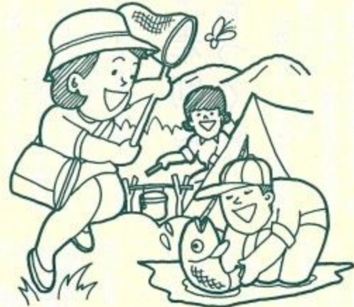
豊かな自然の中の森林ファミリーパーク

その四は、「清らかな水づくり」を進めたいと考えています。また、都市下水路については、国鉄奈良駅周辺地域の浸水解消を図るため新たに菩提都市下水路の整備を計画しています。その五は、「人々がなごむ美しいまちづくりの推進」で