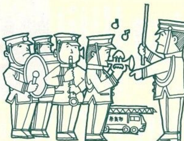
音の防火をめざす消防音楽隊

台風や地震に備え、市民や関係機関の参加を得て防災訓練を引き続き実施するとともに、災害時の対策として奈良県当局と結ぶ防災行政無線端末局を設置し、情報伝達方法を確立したいと存じます。