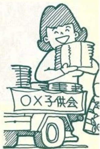
モデル地区を設けてリサイクル運動を

その四は、「世界を平和と発展させるための国際文化交流活動の推進」です。西安市・慶州市・トレド市とは、それぞれ友好都市提携して十年以上となり、各分野