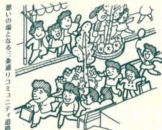
憩いの場となる三条通りコミュニティ道路

奈良の紹介、宣伝をして外人観光客の誘致を積極的に図りたいと存じます。さらに、「歴史の道」案内板、案内道路標識など施設の整備も図りたいと存じます。