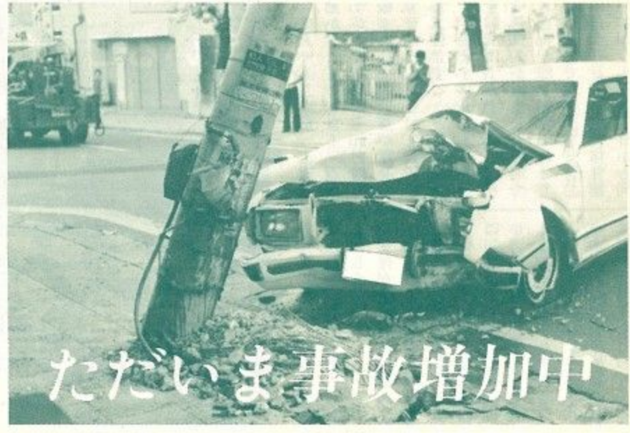
たたいま事故増加中

死亡3・1%、負傷者6・3%、物損事故33・0%がふえています。事故状況を分析したところ、次のような特徴が見られます。