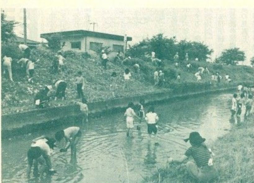
市民組織を育て、自分たちのまち意識をもってもらおう (佐保川清掃対策委員会 佐保川清掃)

定員管理については、将来にわたっても少数精鋭により行政推進を行うことが基本であり、常に定数を見直して計画的な定員管理を行うこととする。そのためには、類似団体別職員数の状況等を活用した定員管理の適正化に努め、年功序列にとらわれない人材の登用と適材適所の人事配置を行うことで組織の活性化と公務効率の向上を図る。