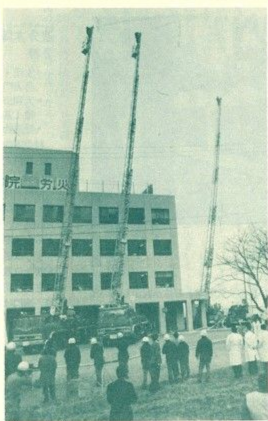
救助活動を終え空に一斉放水するハシゴ車

二、三月にわたって行われた春の火災予防運動初日の二月二十九日午前七時、北和都市連合協議会(奈良・大和郡山・天理・生駒の北和四市で結成)の消防総合訓練が奈良春日病院(鹿野園町)で行われました。 この訓練は、非常時に備えて北和都市圏の連帯的消防機能の充実と強化を図るため毎年行われているもので、今年も中高層化された病院を舞台にしました。「春日病院一階大食堂付近から出火。入院患者の避難誘導をした職員二十人が屋上に残り残され、救助