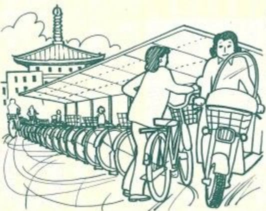
条例でもき自転車置場も拡充されて駅前広場はすつきり

つぎに、有害ゴミの処理についてです。 現在、一般家庭から廃棄される有害ゴミについては、大型ゴミ収集日に出していたりしますが、ややもすれば他の廃棄物に混入する場合があります。分別収集の徹底を期するため、有害ゴミ収集専用車を配置する一方、民間の専門工場に委託してその処理を行います。 つぎは、公害の検査体制の充実です。 清掃工場の煤煙については、現在大気汚染防止法等の基準内にあります。また、検査の徹底を図るためにこの測定回数を倍増するとともに、専門機関に環境保全研究を委託して万全を期したいと存じます。 また、現在公害交通課等で水質汚濁についての検査測定を行っています。これを青山区下水処理場の検査室で一元化を図りたいと考えています。