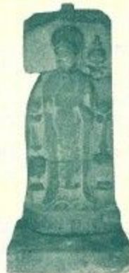
石造浮彫弥勒菩薩像