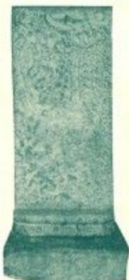
石造浮彫仏涅槃像

墳丘は削られて原状をとどめない。竪穴式石室と石棺が露出しているが、石棺は古い様式をよく残し、かつ保存状態もよい。石棺が見られる古墳は市内では他になく、資料としての価値が高い。すでに整備され、保護施設も設けられている。現存する墳丘は南北約22m、東西約11m、高さ約4m。