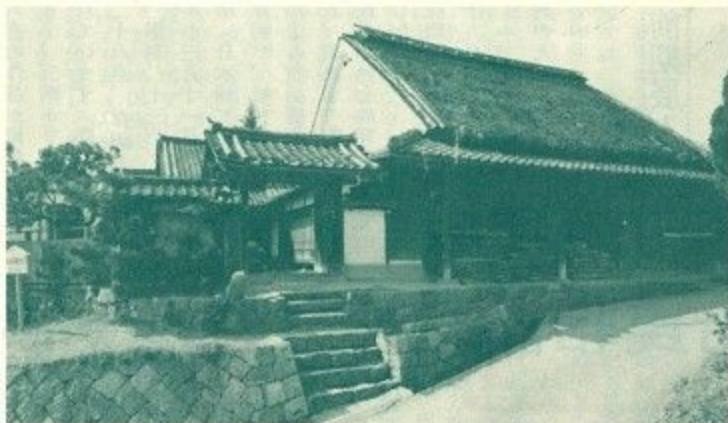
追分本陣村井家の正面

主屋は切妻(きりづま)造り段違い、茅(かや)および檜瓦葺(ひのかわらぶき)、本陣座敷は切妻造り・檜瓦葺、表門は棟門・檜瓦葺。