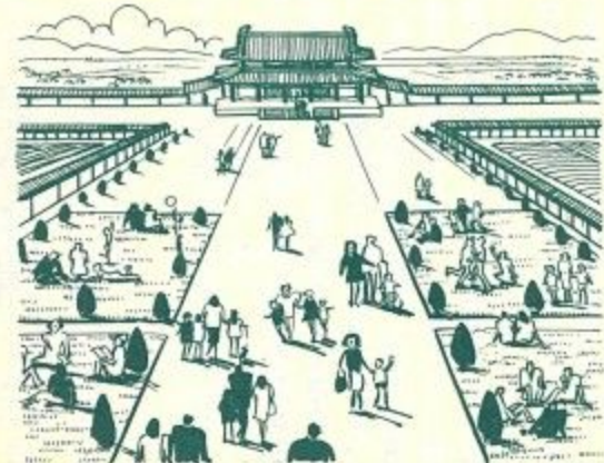
市民だんらん場の場となる朱雀大路

うのみでなく、奈良市にとっては重大な意味を持つています。私は朱雀大路復元事業を中心に、国際文化観光都市として伝統と調和のとれたまちづくりを進めたい所存です。この朱雀大路の復元は、古城宮跡の復元に合わせ、古代シンボルゾーンとして整備す