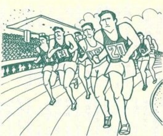
心温まる応待で成功させよう「わかき公園」

その三は、スポーツ活動の振興です。市民の体育活動の基盤となる施設整備については、五十九年度においては、青山近隣公園でプール、テニスコート三面と佐保山近隣公園でテニスコート二面を使用開始するとともに、鴻ノ池運動公園でも国体終了後にテニスコート十面を設置しますが、今後とも都市公園の整備の中で、