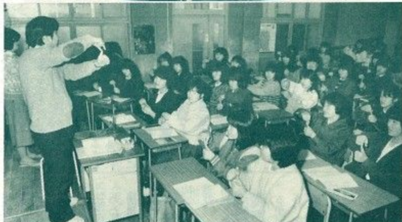
身障者の大会めざし懸命に手話の練習をする女生徒(奈良保育学園で)

「わかくさ国体」と「わかくさ大会」二つのスポーツの祭典が成功するかしないかは、奈良県選手団がどのような活躍をするかに大きなウェイトがかかっているのはもちろんですが、最も大切なのは、日本全国から訪れる参加者が、奈良の好印象をみやげに、満足してそれぞれのふるさとに帰って来るといふことではないでしょうか。