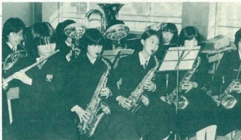
放課後真剣に練習に打ち込む中学生 (富雄中学校で)