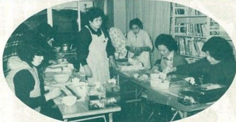
胸花づくりに励む主婦たち (春日公民館で)