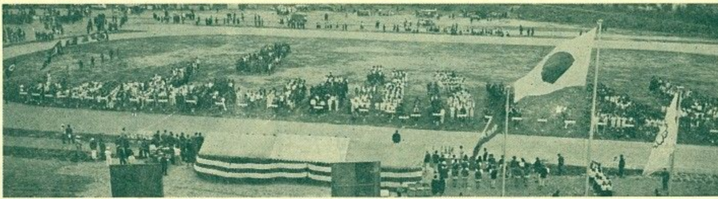
2500人が集まって開会式 (鴻の池の陸上競技場で)