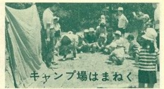
キャンプ場はまねく