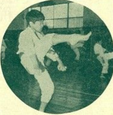
豆選手もエイヤッ (空手) (京東道場で)