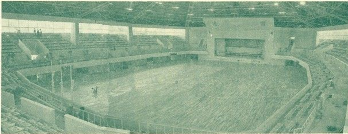
広々とした体育館内部