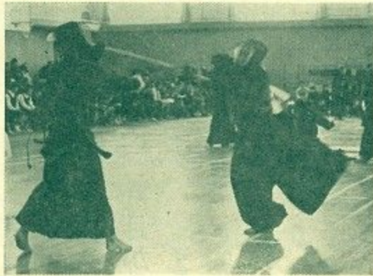
竹刀にも気合いがこもる (高校男子剣道) (正強高校体育館で)