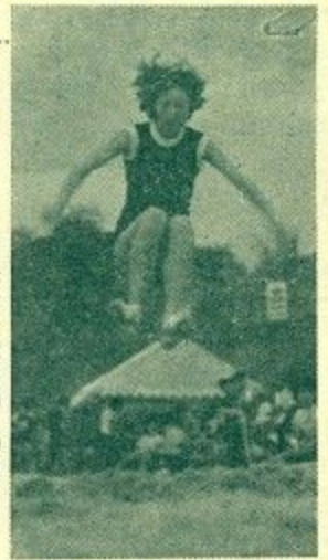
大地をけて... (中学女子走幅跳) (鴻の池の陸上競技場で)