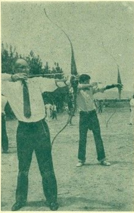
腕に覚えの老選手も... (アーチェリー) (柏木町の清掃事務所広場で)