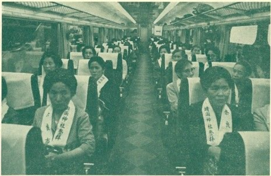
靖国の対面に心はずませる戦没者の 夫人たち (近鉄特急車内で)