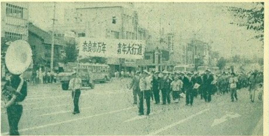
【写真】上左—満場の福祉大会会場 上右—1200人の万年青年大行進 下右—大行進参加の西野サダさん(90歳)と親しく語る鍵田市長