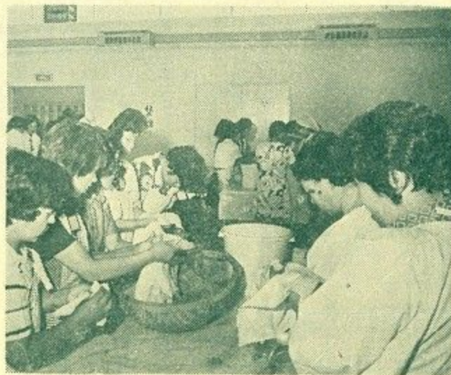
熱心に玉ねぎづけを習う主婦ら