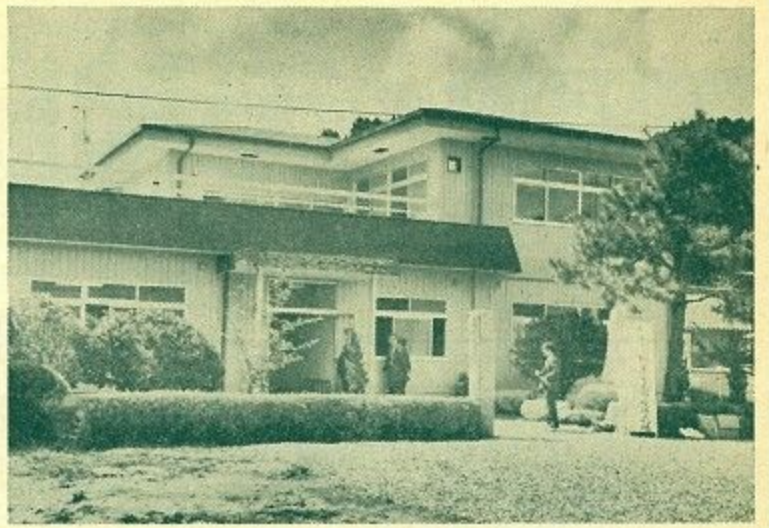
見事出来上がった柳生公民館