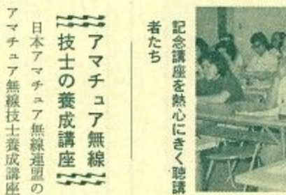
記念講座を熱心に聴講者たち

奈良・西安友好都市提携の記念講座 中国西安市との友好都市提携を記念して「奈良・西安友好都市提携記念講座」が八月一日から市立西部公民館で始まり、この講座は友好都市西安市