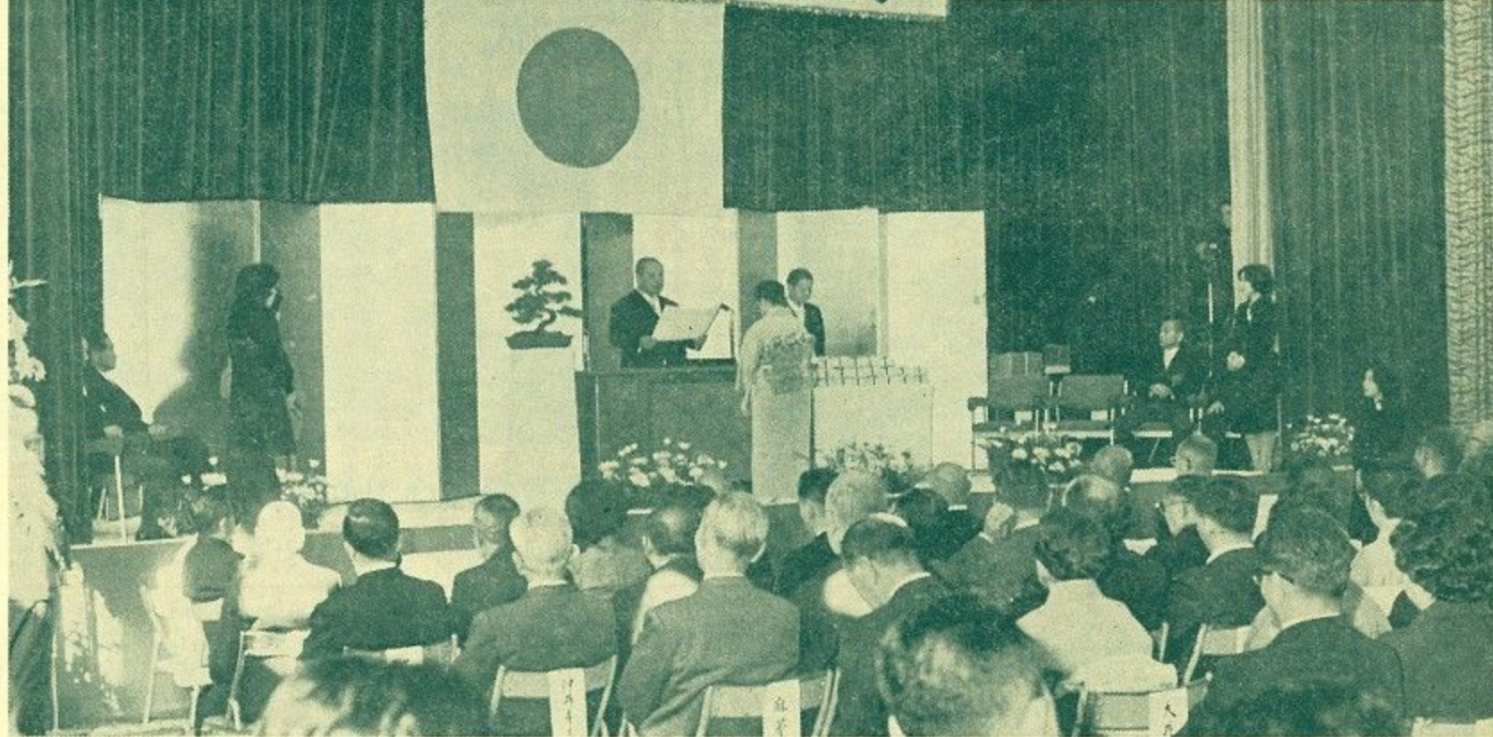
菊花かおる「文化の日」に輝く表彰式(市庁舎別館で)