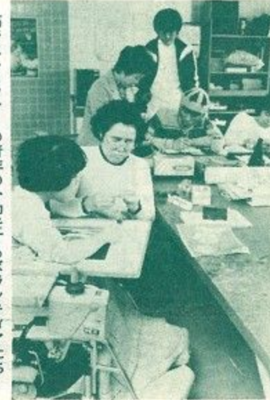
筋ジストロフィーの青年の介助をするボランティアたち

ボランティア活動をしてみ ようと思っっている人は意外に 多いのですが、きっかけがな かなかないんじゃないかし ら。ご近所の方や、お友だち といっしょにはじめられると