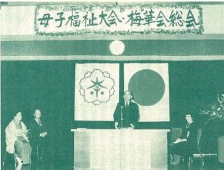
母子福祉大会・梅華会総会