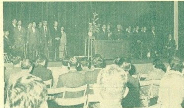
奈良出発時の壮行会 (10月3日市庁舎別館で)