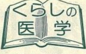
こむらがえりはこのようにして

運動のしかたを急に変えたりした時。環境温度が急激に変化した時(水泳、炎天下の運動など)。