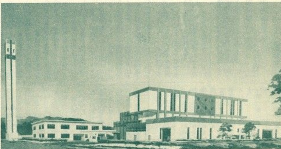
清掃工場に新設される新鋭ゴミ焼却設備完成予想図

新しいゴミ焼却施設は、五十三億五千七百四十万円をかけ、昭和六十年三月完成をめざしてあります。このゴミ処理施設は現在の清掃工場敷地内で、現焼却炉の北五十坪の場所に建設されます。 新しいゴミ処理施設は一日百二十トンの焼却能力のある焼却炉を三基備えており、全体で一日三百六十トンの焼却能力があり、焼却炉の運転はゴミの燃焼状態をコンピュータで管理し、自動的に制御して完全に燃焼させる近代的なものです。また、焼却灰の中に残る金属類は回収して資源の再利用をはかります。さらに