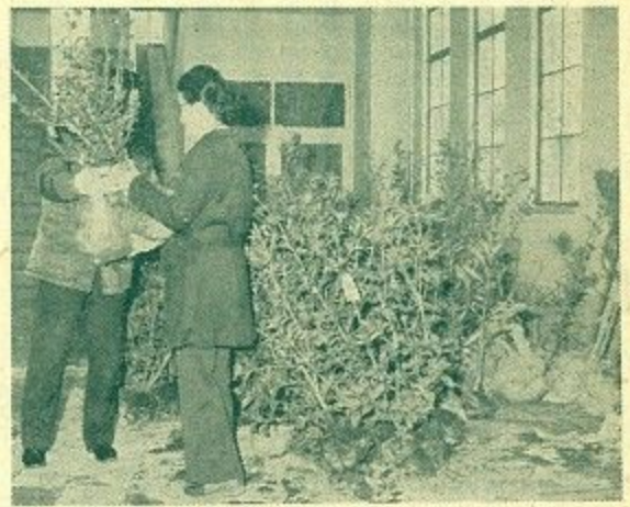
苗木をどうぞ (2月28日市庁舎別館で)