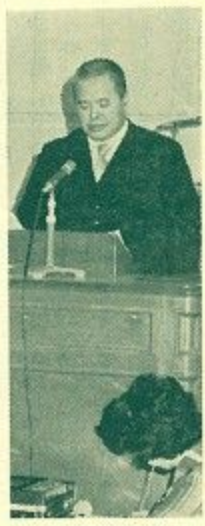
提案説明する 鍵田市長

道事業、国民健康保険などの十二特別会計予算は六十六億六千二百六十八万八千円で同九六・八%の増、これは庁舎建設事業に二十二億二千六百