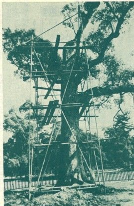
再生を願って大手術を受けたイチイガシの大樹

イチイガシはブナ科の常緑樹だが、環境に極めて敏感なのが特徴。こんど手術を受けたのは「雪消の沢」東側にそびえ立つ樹齢三百年を数える巨木で幹の周囲約三メートル、かつては高さ二十メートルもあつたが、最近腐朽による侵食で樹勢が衰え、梢から枯れて高さが約十メートルに半減してしまいました。