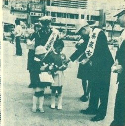
「車に気をつけてね」と木山市長も先頭立って交通安全を訴える

春の交通安全運動が四月六日から十五日までの十日間、全国いっせいにくりひろげられました。運転者向けには「危険です 寝不足積み過ぎ」