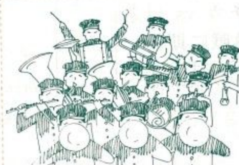
中学校の吹奏楽部を育成

新設用地の取得をはかるほか、一小学校、三中学校、一幼稚園の校舎の増築、また佐保・富雄両幼稚園の移転用地、明治小学校、富雄・平城両中学校の拡張用地の確保の各措置を講じました。 さらに、水間小学校、若草・富雄両中学校の屋内運動場を新・増・改築するほか、都