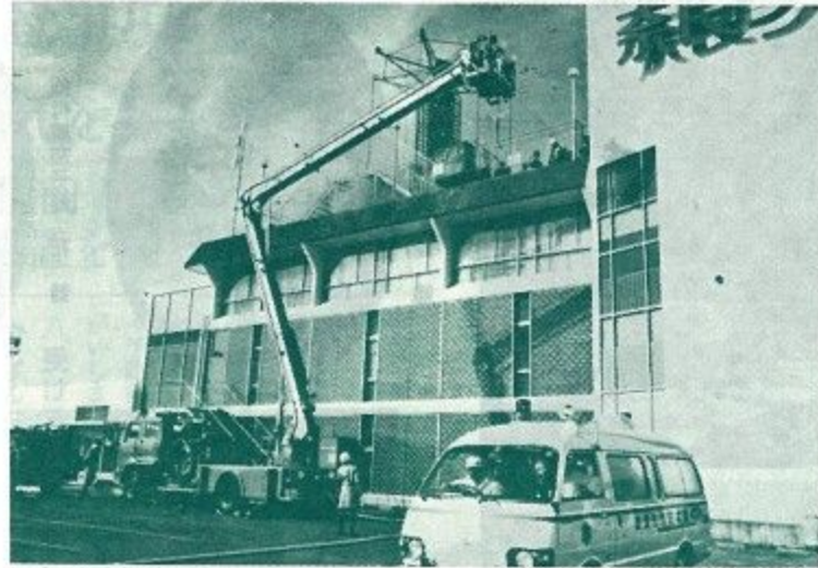
屋上の避難者をシュノーケル車が手ぎわよく救出