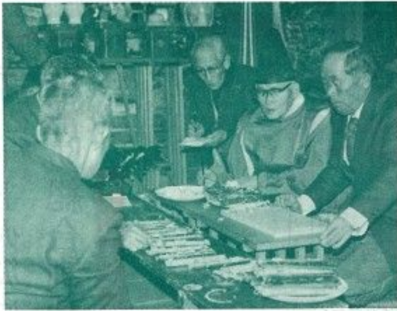
登弥神社の粥占い