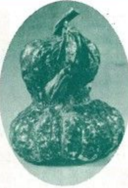
飾付唐茄子形花器