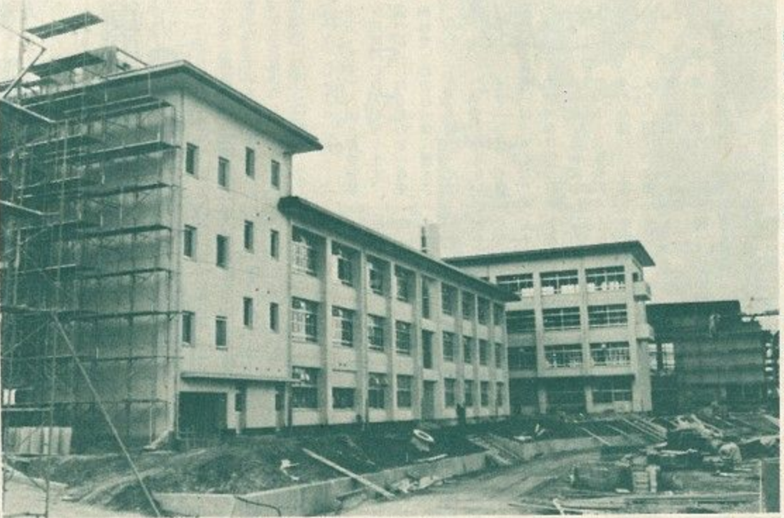
新学年とともに新築開校する【上】第十四中学校 【下】第三十九小学校(いずれも仮称)