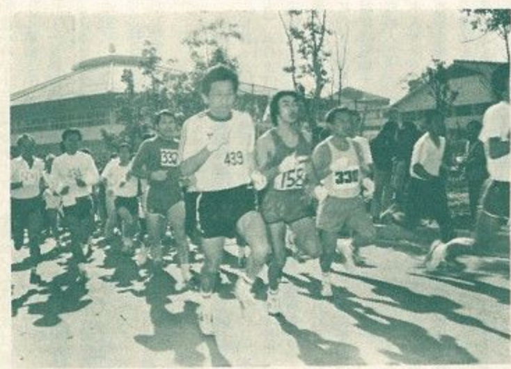
それとばかり中央体育館前を飛び出した第一部10.4の選手たち

表の石工が築いたと印されています。屋敷内の五つの陳列室には柳生の里の歴史資料などが展示されていて、新しい柳生の観光名所として脚光を浴びています。