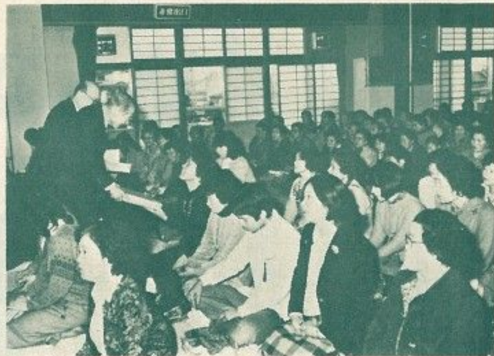
「ご苦労さまでした」とお母さんにプレゼントを渡す木山市長