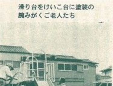
滑り台をけいこ台に塗装の腕みがくご老人たち