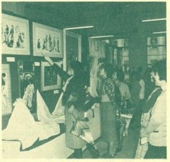
学級生の見事な作品に見入るご婦人(中央公民館で)

れました。参加したのは七チーム九十人の選手と応援の主人や子どもたちも百人。この大会は同協議会が昭和四十七年から、同和地区の婦人の健康増進と親和をはかるため開いているものです。