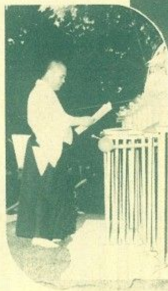
古都の夜空に「あかあかと大文字」の字。