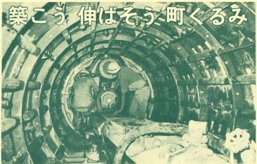
シールド工法で下水管を敷設