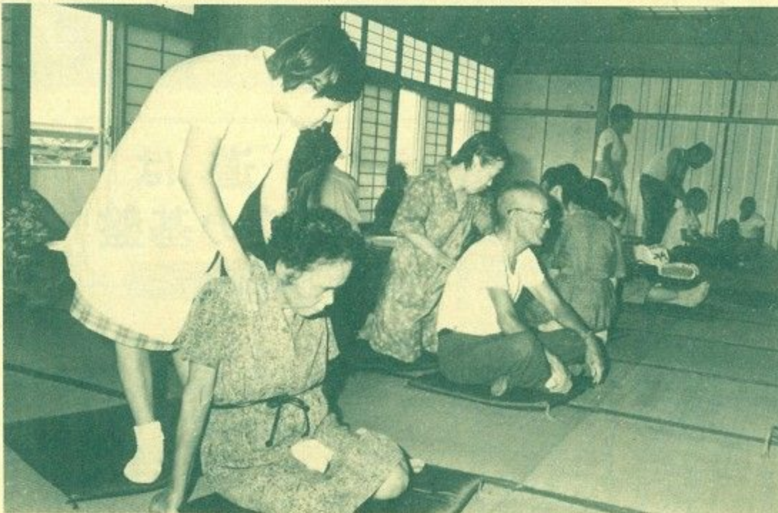
ご老人にアン・マッサージを奉仕する市視力障害者協会の人たち

九月は十五日の「敬老の日」を中心として、老人福祉をはじめとする奈良市の「福祉月間」。 奈良市は全国に先がけて福祉都市宣言をし、福祉意 九月は十五日の「敬老の日」を中心として、老人福祉をはじめとする奈良市の「福祉月間」。 奈良市は全国に先がけて福祉都市宣言をし、福祉意