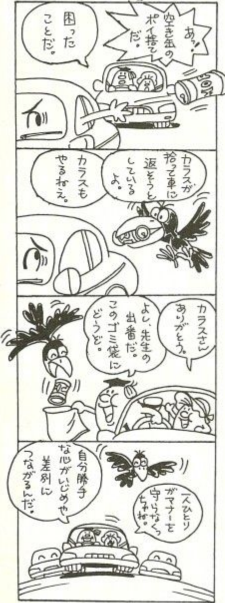
奈良市人権問題啓発活動推進本部