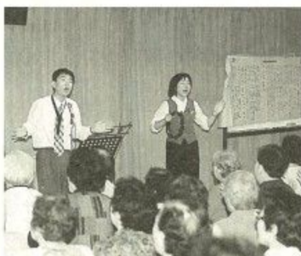
市内の福祉施設で活動する音楽療法士