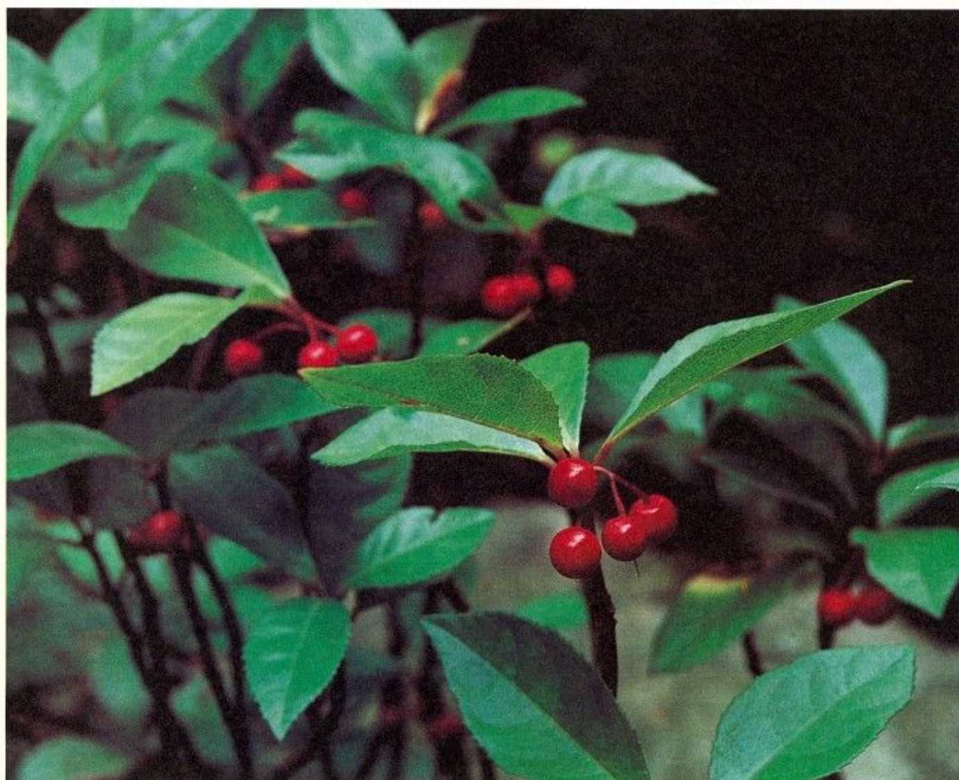
彩りあざやかに赤い実をつけるヤブコウジ