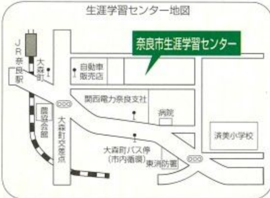
生涯学習センター地図

どのグループ活動のニーズに対応できるようになっています。センター主催の事業は二階の視聴覚室、三階の学習室一、二、三で主に行われますが、公民館での学習と違うところは、独自の単位制を導入している点です。奈良市生涯学習大学として、取得単位数に応じて「学士号、修士号、博士号」などの称号が取得できます。いつ、だれが一番乗りか今から楽しみます。なにかをしてみたいけれど、とためらっている人は、センターに気軽に声をかけてみてください。あなたのしたいことをすでに始めているグループを紹介してもらえます。時間は午前九時から午後九時まで総勢八人のスタッフが相談のつてくれます。まずは、生涯学習センターを利用してみてください。