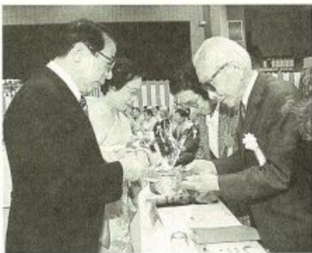
お祝いの言葉をかけながら参加者全員に祝酒を注ぐ大川市長夫妻