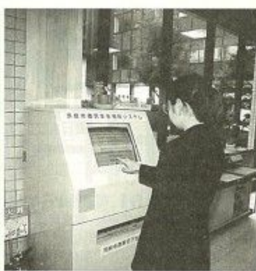
国民年金相談窓口用ディスプレイ

・農家基本台帳及び農業委員会委員選挙人名簿のOA化、水道マップインクシステム、給水自動監視制御装置、国民年金相談窓口用ディスプレイ等の導入を進めました。