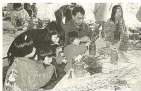
主催教室「親子で正月飾りづくり」

センターの周りは緑いっぱい。センターを飛び出して、「剣豪の里・柳生」の史跡を訪ねるハイキング、近くの川での水遊び、森林浴など四季を