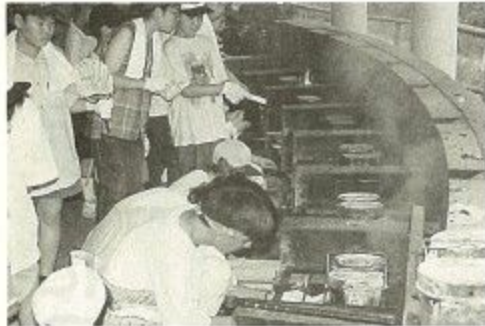
野外炊事場で楽しい飯ごう炊飯