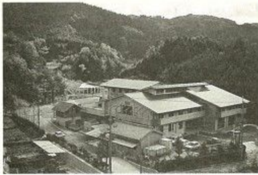
青少年野外活動センターの全景