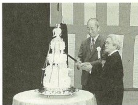
結婚五十年のウエディングケーキに入刀する中村さん夫婦

結婚五十年を迎えるご夫妻を祝う金婚祝賀会が、十一月三日「文化の日」に中央体育館で開かれました。 はじめに大川市長は、戦後まもなく結婚され、日本の復興とともに時代を歩んでこられたことから「今日の日本があるのはみなさんがそれぞれの立場で社会のために頑張ってくれたおかげ」と感謝の言葉を述べ、また「今年が奈良市制百周年、つぎの百年の発展のために若者たちにみなさんの経験や知識を伝えてください。そして、身体