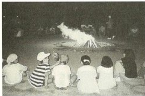
より友情を深めるキャンプファイヤー

●施設の概要 豊かな自然に恵まれたこのセンターは、青少年たちが四季折々の変化の中で自然に親しみながら豊かな心を養い、集団生活や野外活動を通じて「規律・協同・友愛・奉仕」の尊さを学ぶ場として平成元年に開所しました。宿泊室も備え、研修、野外活動、スポーツ、レクリエーションなど幅広く利用できる施設です。 一日の利用定員は宿泊・日帰りも含めて百人。心と体を鍛え、夢を広げる自然との「出会いの広場」として利用してください。