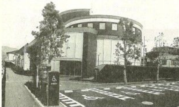
生涯学習センター