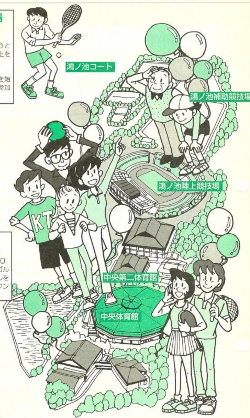
鴻ノ池補助競技場