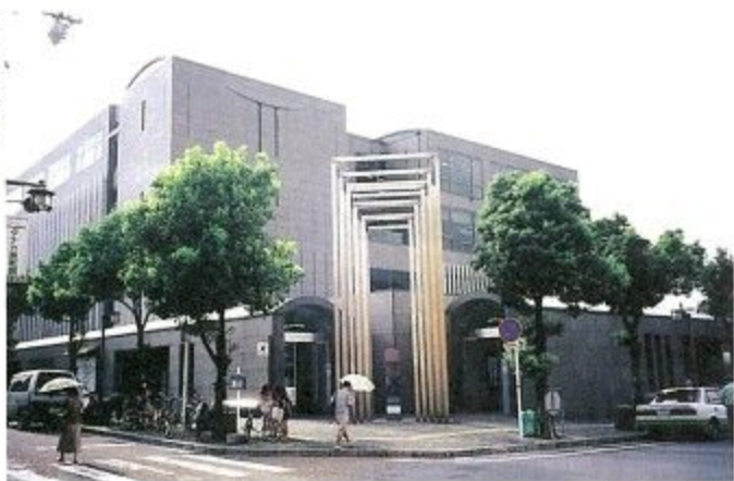
中央図書館 (ならまちセンターの三・四階)

西部図書館は、近鉄学園前駅から北へ一キロ・鶴舞西町にあり、一階が児童室、二階が一般室、三階は視聴覚室の単独館です。