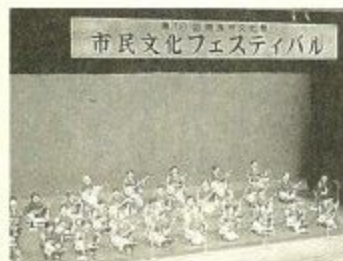
市民文化フェスティバル