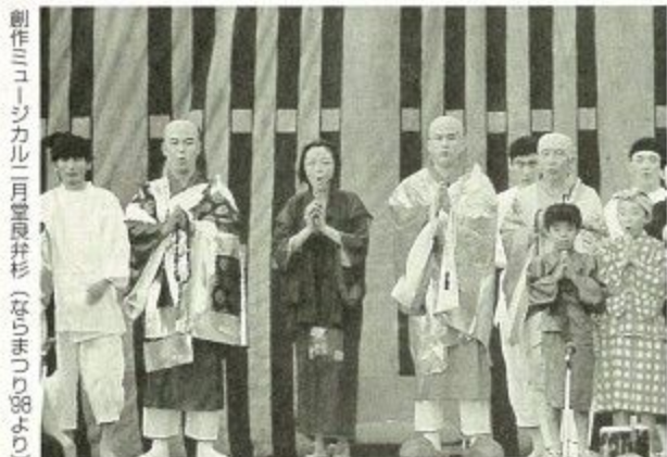
創作ミュージカル「二月堂良弁杉」(ならまち88より)

市制100周年を記念して、ゆかりある東大寺での奉納公演を行います。今回は、演出を盛り上げるため、出演者・スタッフと同様に一般公募により結成された100人を超える合唱団が新たに加わり、音楽は生演奏で行います。