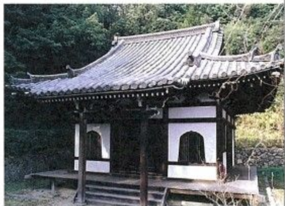
こんぶいんたまや 興福院霊屋（奈良市法蓮町881番地）

代々の徳川将軍の位牌をまつるための建物で、正徳5年（1715）の建立と伝えられています。装飾の一部に三葉葵（みつばあおい）の紋が用いられ、内部には江戸時代中期の画家・渡辺始興の美しい障壁画があり、南都と徳川家の関わりを今に伝える貴重な文化財です。