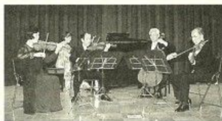
アンサンブルエレウテリアの演奏

深まりつつある秋の一日をたえなる弦の響きですばらしいスクリーンミュージックなどを楽しんでください。