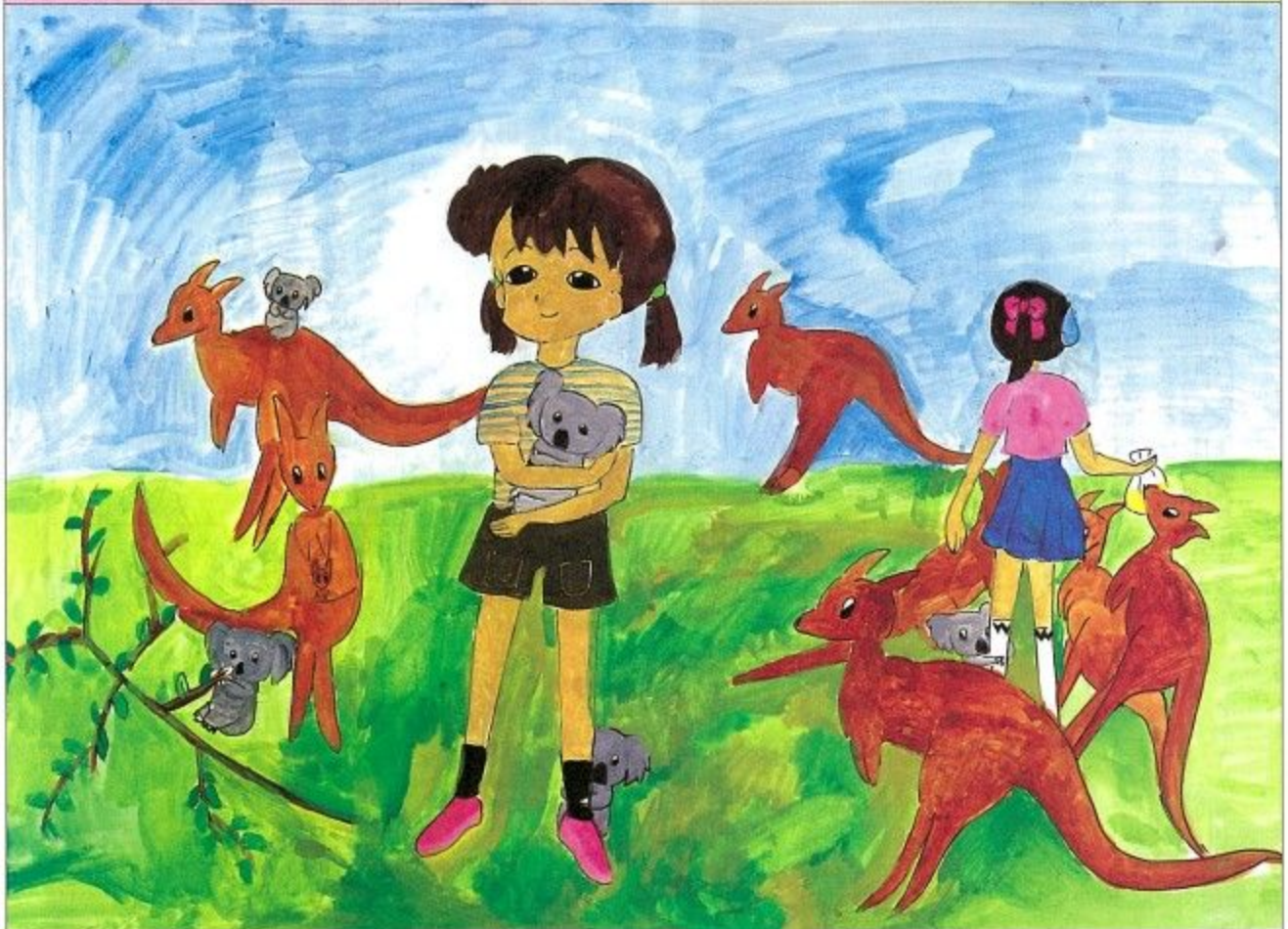
「友好姉妹都市児童・生徒交換作品展」出展作品

発行 奈良市教育委員会 奈良市二条大路南一丁目 TEL 0742 (34) 1111