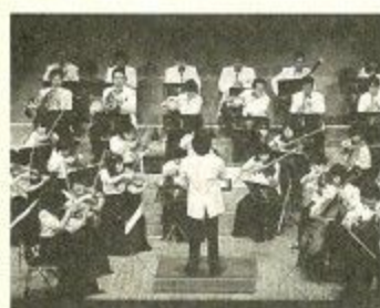
ならチェンバーオーケストラ