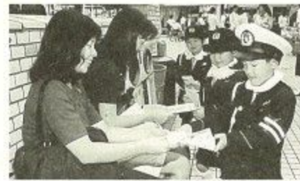
チャイルドコップの街頭啓発