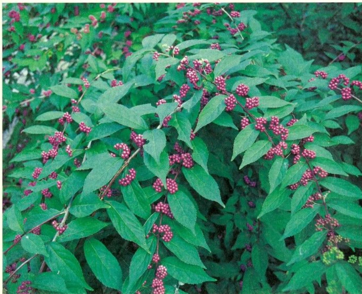
紫色の小さな実をつけたコムラサキ