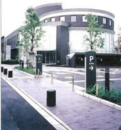
（仮称）生涯学習センター（杉ヶ町）

史跡の保存整備、指定文化財の保護や老朽化した埋蔵文化財調査センターの改築事業等を行っています。