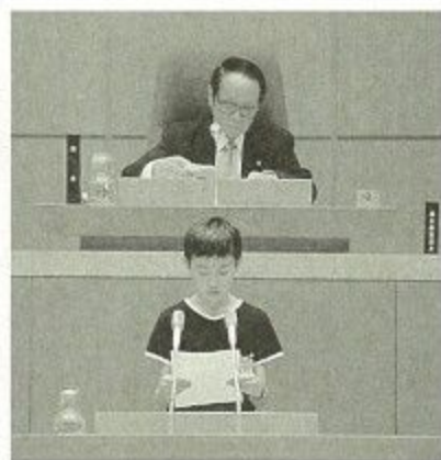
子ども議会の議長を務める浅川市議会議長(上段)

また、文化財の保護については、消防局に、今年度から専門の文化財防災官を任命し、消防体制を強化しています。