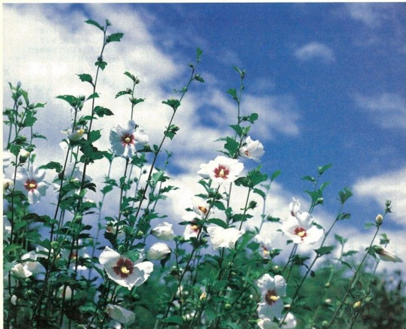
さわやかな青空に向かって、花を咲かせるムクゲ