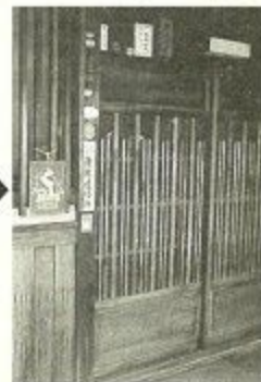
地域安全の家の玄関にはプレートがかかっています