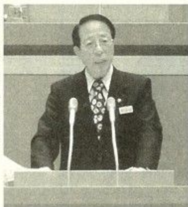
召集あいさつをする大川市長

また、県道の枚方大和郡山線が富雄南地域で一部非常に狭くなっていますので、バイパスをつける計画があると聞いています。市としても一刻も早くバイパス道路ができ、通学