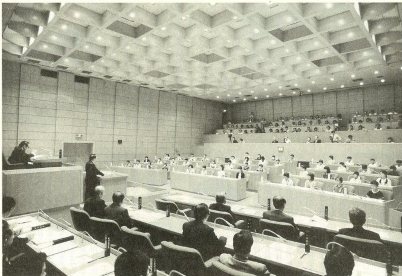
市立小学校44校の代表が市議会議場に集まりました