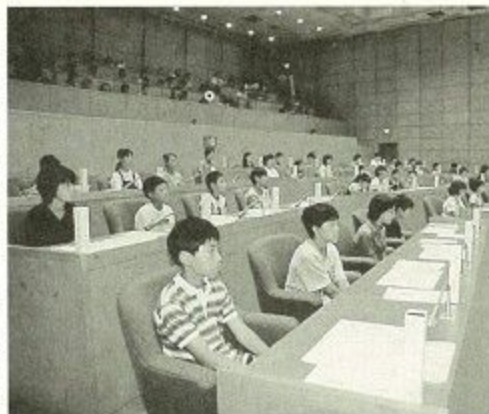
大川市長の答弁に熱心に耳を傾ける子ども議員たち

また、お年寄りと会う機会が少ないということですが、お年寄りは長年、社会のために尽くしてきた方です。その豊かな体験から生まれた知識をいろいろと学んでいただきたいと思っています。たとえば、ならまちに音声館があり、昔ながらの遊び